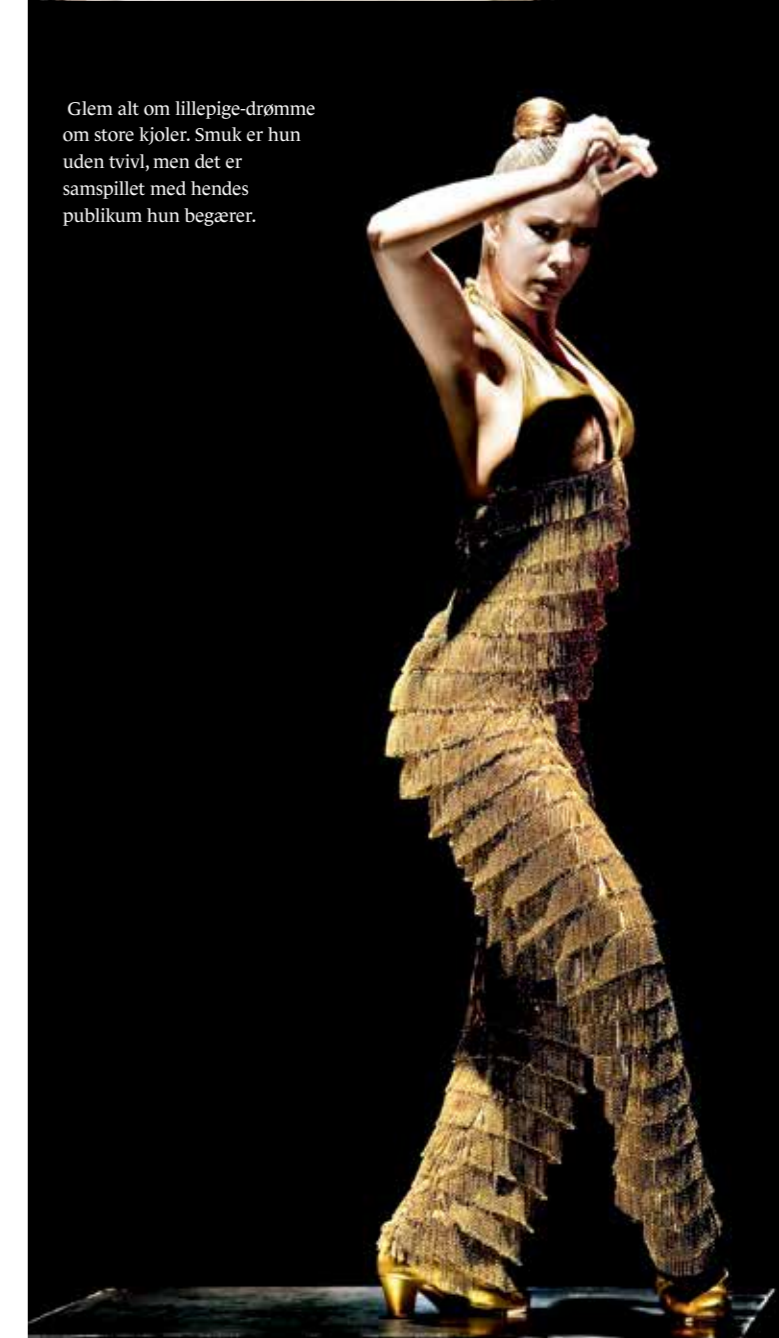
Glem alt om lillepige-drømme om store kjoler. Smuk er hun uden tvivl, men det er samspillet med hendes publikum hun begærer.